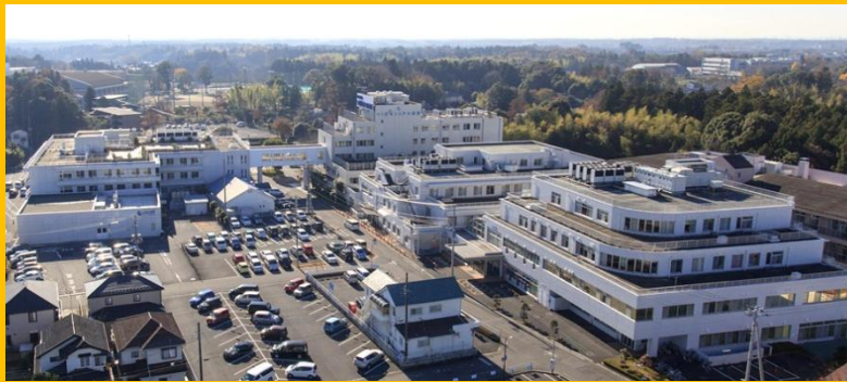
つくばセントラル病院 外観