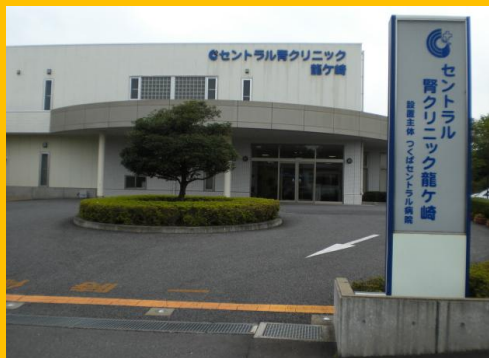
セントラル腎クリニック龍ヶ崎 外観